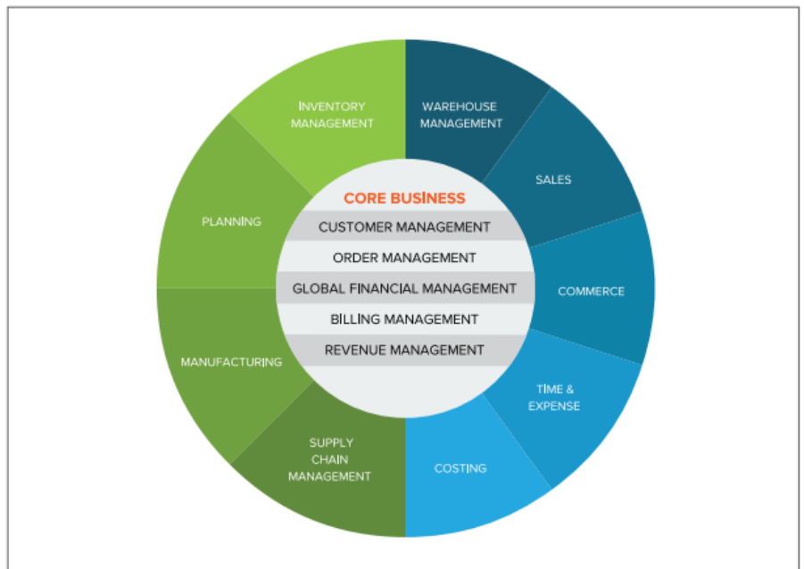
图 1: NetSuite 为制造业者提供一个全面的业务解决方案

因为这是一个基于云的应用程序，制造商可以受益于 NetSuite 的丰富功能，和传统方法相比，节省了大量前期成本。